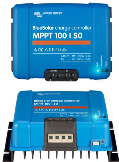
Solar Charge Controller MPPT 100/50