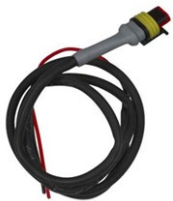
Besturingskabel voor Cyrix-ct 12/24-230 Lengte: 1m