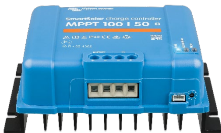
SmartSolar Laadcontroller MPPT 100/50