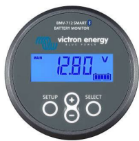
Bluetooth-detectie BMV-712 Smart Battery Monitor