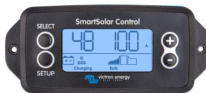
SmartSolar inplugbaar display

Verwijder hiervoor de rubberen afdichting die de plug aan de voorkant van de controller beschermt en sluit het display hierop aan.