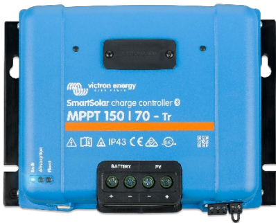
SmartSolar Charge Controller MPPT 150/70-Tr zonder optioneel beeldscherm