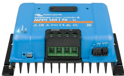
SmartSolar laadcontroller MPPT 150/70-Tr zonder display