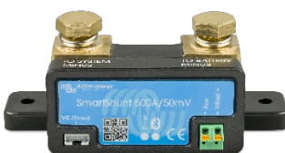
Bluetooth detectie: SmartShunt