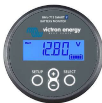
Bluetooth-detectie: BMV-712 Smart Battery Monitor