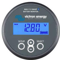
Bluetooth-waarneming: BMV-712 Smart Battery Monitor