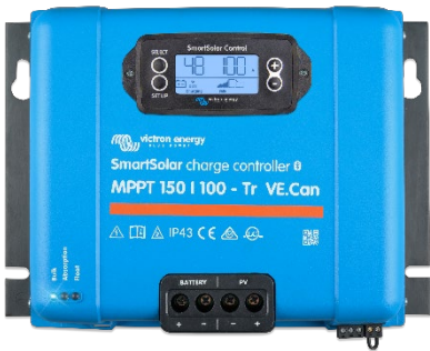
SmartSolar Laadcontroller MPPT 150/100-Tr VE.Can met optioneel insteekbaar beeldscherm