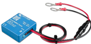
Bluetooth-waarneming: Smart Battery Sense