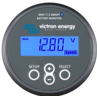
Bluetooth-detectie BMW-712 Smart Battery Monitor